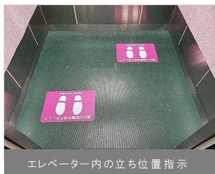
エレベーター内の立ち位置指示