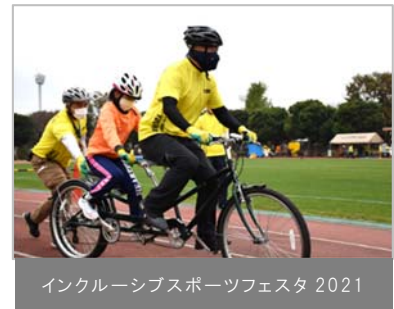
インクルーシブスポーツフェスタ 2021