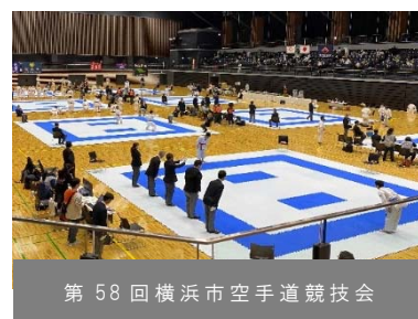
第58回横浜市空手道競技会