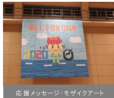
応援メッセージ・モザイクアート

さらに、共生社会の実現に向け、健康体操教室など、障害の有無に関わらず誰もが気軽に参加できる事業や高齢者向けの事業を、近隣施設やスポーツ関連団体、民間企業と連携して行いました。