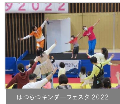
はつらつキンダーフェスタ 2022

3月29日(火)には、横浜武道館にて「はつらつキンダーフェスタ 2022」を開催しました。