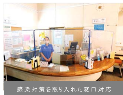
感染対策を取り入れた窓口対応