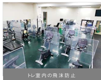
トレ室内の飛沫防止