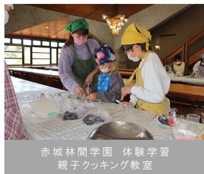
赤城林間学園 体験学習 親子クッキング教室