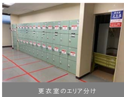
更衣室のエリア分け