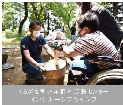
くろがね青少年野外活動センター インクルーシブキャンプ