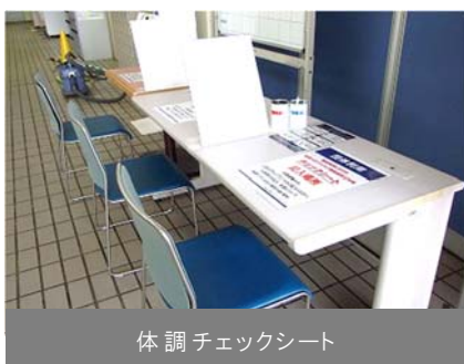
体調チェックシート