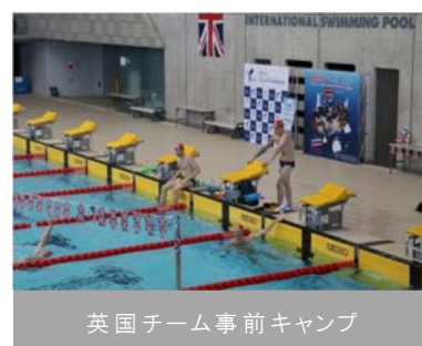
英国チーム事前キャンプ

また、Bリーグ（横浜ビー・コルセアーズ）の試合は、コロナ感染症防止対策を講じて入場者数の制限を実施しながら 20 試合が開催されました。