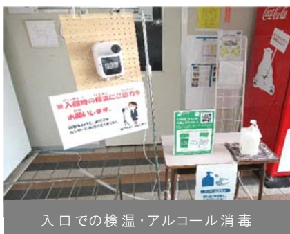
入口での検温・アルコール消毒