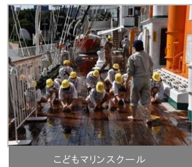
こどもマリンスクール