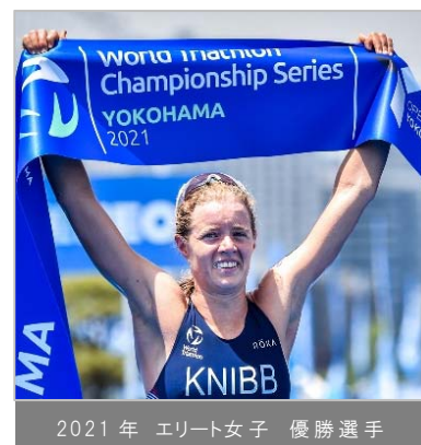
2021年 エリート女子 優勝選手