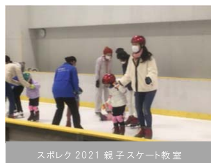
スポレク 2021 親子スケート教室