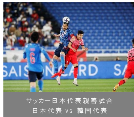
サッカー日本代表親善試合 日本代表 vs 韓国代表