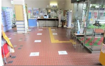
ソーシャルディスタンス