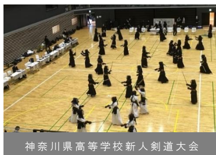
神奈川県高等学校新人剣道大会