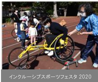
インクルーシブスポーツフェスタ 2020