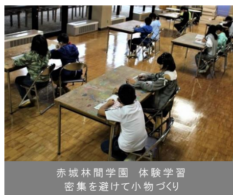
赤城林間学園 体験学習 密集を避けて小物づくり