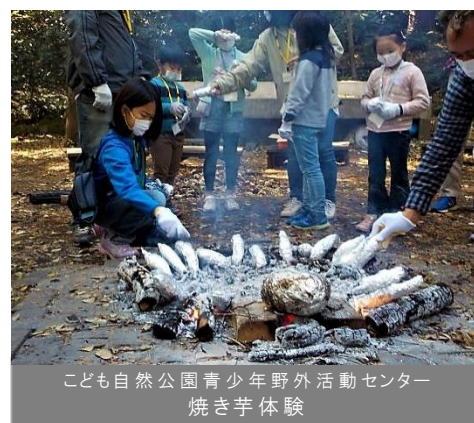
こども自然公園青少年野外活動センター 焼き芋体験