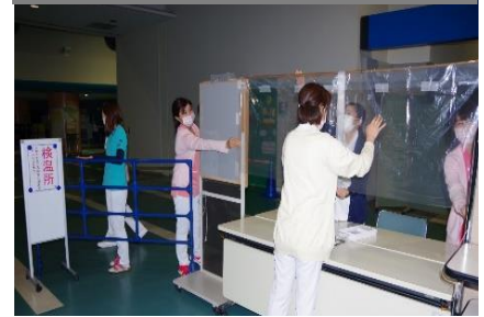
体調チェックシート