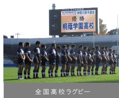
全国高校ラグビー