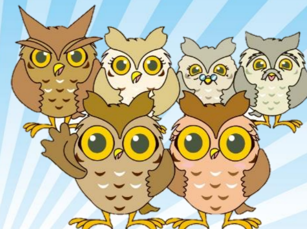
瀬谷区マスコットキャラクター せやまる