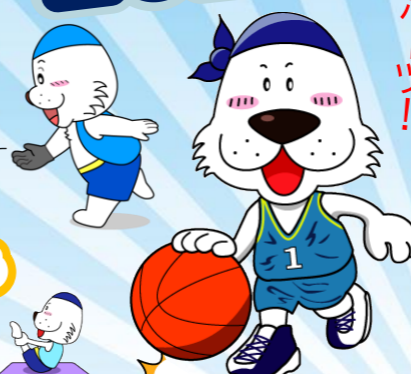
キャプテンわん