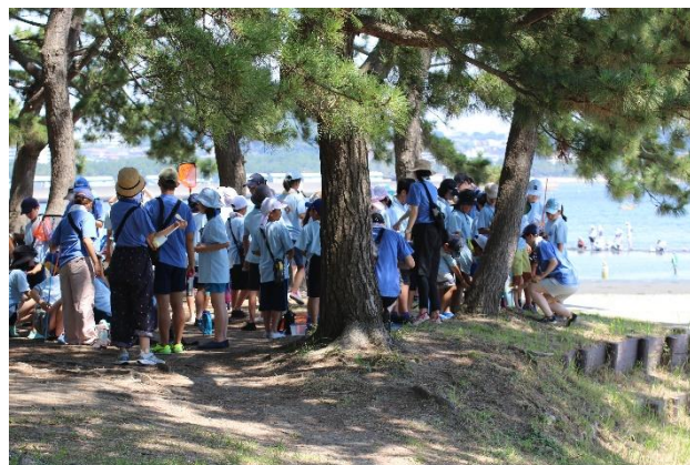
野島公園(活動イメージ)