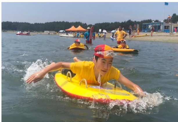
ライフセービング教室