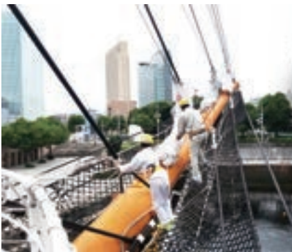
バウスプリット渡り★