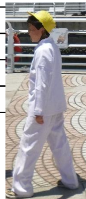
白い訓練服を着て活動を行います。