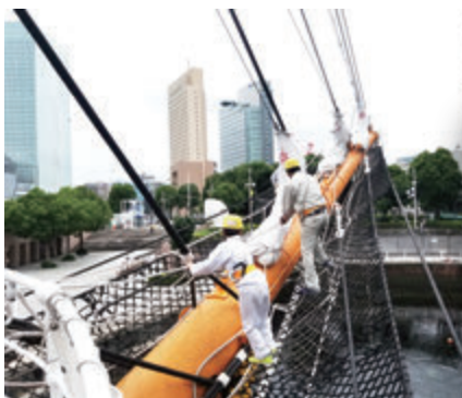
バウスプリット渡り★