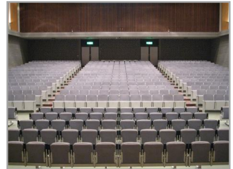
栄公会堂講堂客席